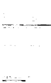
セミナーレポート