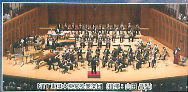
NTT東日本東京吹奏楽団 (指揮: 山田 昌弘)