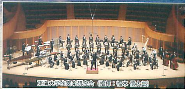
東海大学吹奏楽研究会 (指揮: 福本 信太郎)

2016 3/13 [日] 14:00開演 (13:00ロビー開場 13:30各 席開場)